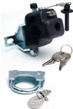
Скоба крепления на штангу седла